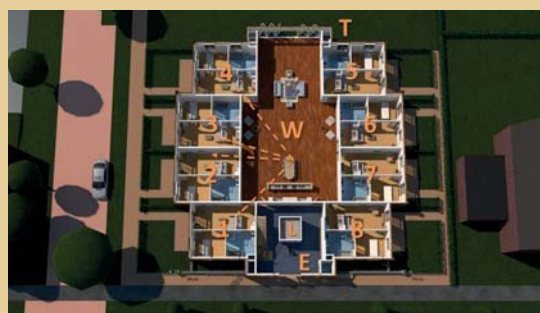
Overzicht van zichtlijnen binnen het CarMar huis

Hiervoor hebben het volgende idee uitgewerkt, namelijk een obligatielening zonder risico! Mocht de stichting CarMar noodgedwongen de exploitatie moeten beëindigen, dan kan het huis eenvoudig worden omgebouwd tot een riant appartementengebouw waardoor uw inbreng zijn waarde behoudt.